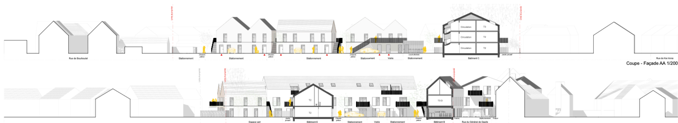
Coupe - Façade AA 1/200