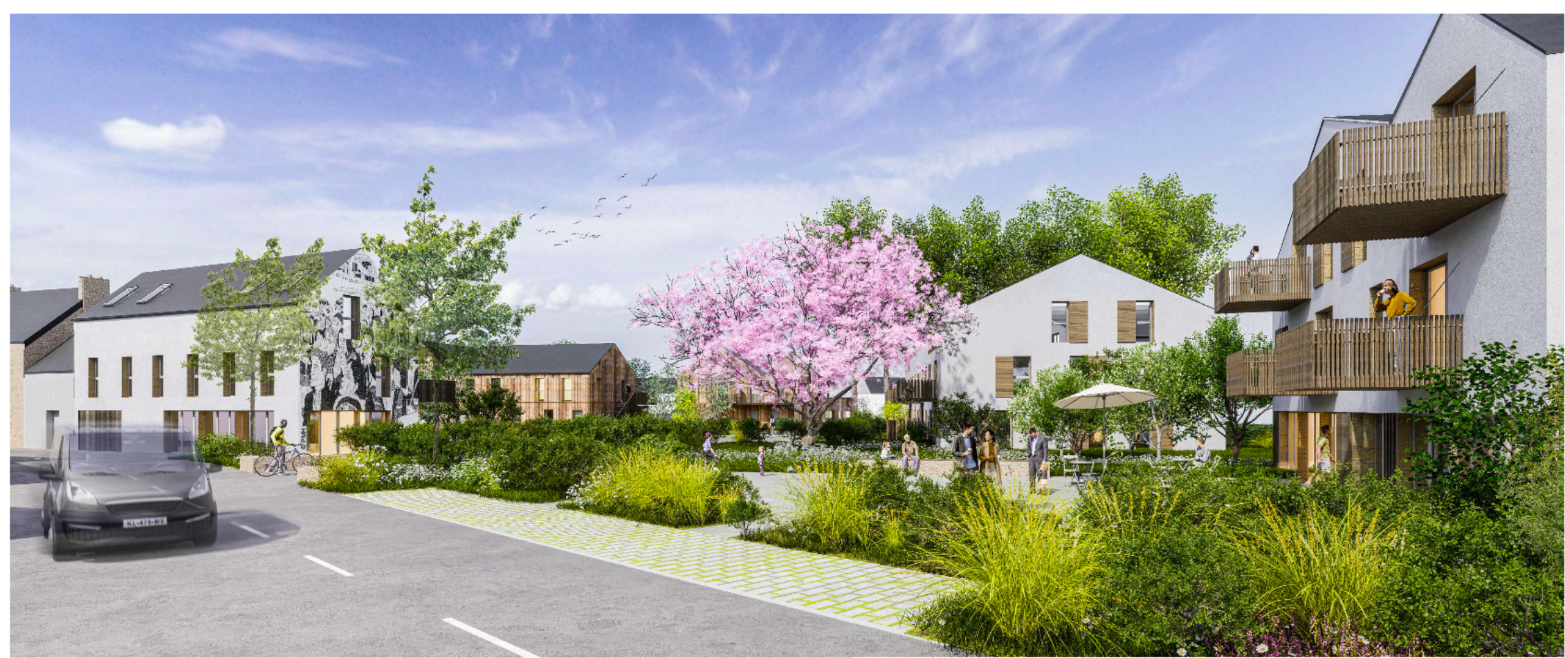
Perspective sur la place du Magnolia