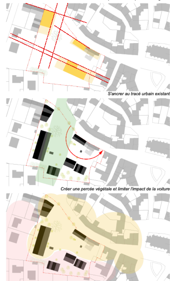
S'adapter aux typologies environnantes : pavillonnaire, collectif et commerces